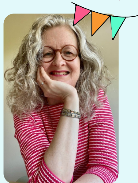
LEVENSLOOPSYCHOLOOG & COACH

Ik ben levensloopsycholoog & coach en ik wil je op een andere manier laten kennismaken met de kracht van positieve psychologie. Benieuwd hoe positieve psychologie jou kan helpen bij verandering? Ontdek het in een vrijblijvend kennismakingsgesprek. Kijk op www.estheroosterling.nl .